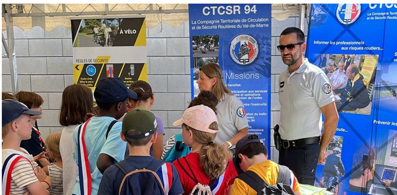
Action organisée au commissariat de Saint-Maur-des-Fossés en juin 2022

L'année 2023 sera l'occasion de fixer la stratégie départementale pour les 5 ans à venir à travers l'élaboration du document général d'orientations 2023-2027.